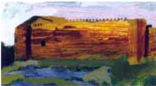
"Casa del Sol"