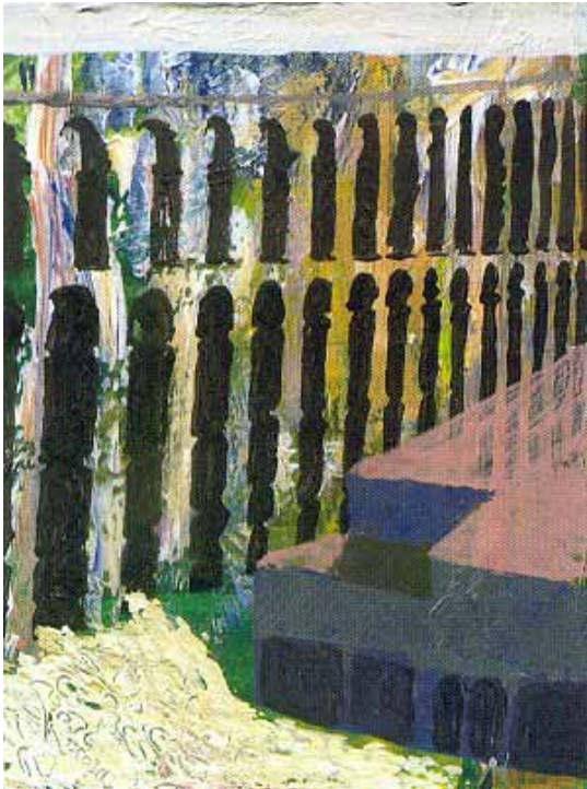
“Río de lana, río de oro”