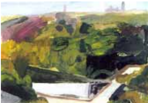
"Segovia, oasis verde"

explosión de la vida. Si en el interior del templo se celebra el triunfo del espíritu sobre la muerte, en el exterior se festeja la resistencia de la carne donde se alberga el espíritu, su provisional victoria sobre los rigores del invierno y las penitencias cuaresmales.