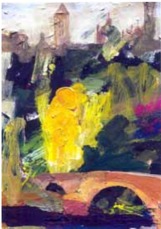
“Puente de la moneda”