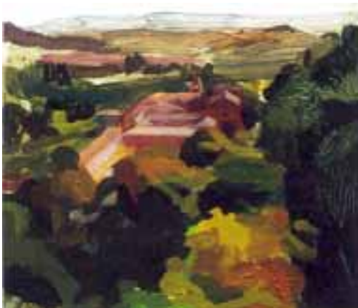
"Valle del Eresma"

muralla que se alza a nuestra izquierda, recatada entre la espesura de la vegetación; ni al barrio de San Lorenzo, a la derecha, hundido en el valle, rojo de tejados, con sabor a pueblo y aroma de pan caliente. Para remediarlo te propongo una corta salida del itinerario que me parece imprescindible: ¿Ves una puerta en la muralla, precedida por una cruz de piedra? Pues vamos hacia ella. . Se trata