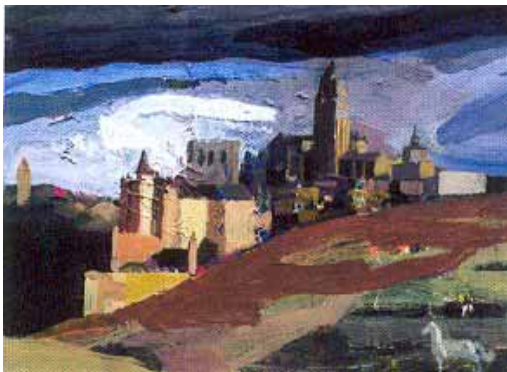
"Navío de piedra"

Hacia uno de estos valles nos dirigimos ahora, un valle sin río, o con un río fantasma del que sólo vas a conocer su nombre: Clamores. Hasta los años finales del siglo XX , la desembocadura de este afluente del Eresma se realizaba justo a los pies del alcázar, en la misma proa de ese barco mineral que así redondeaba su imagen metafórica de quilla entre dos aguas. Mas decir río era mucho decir, como lo era decirle agua al hediondo flujo de la cloaca en que el Clamores se había convertido. Resolver