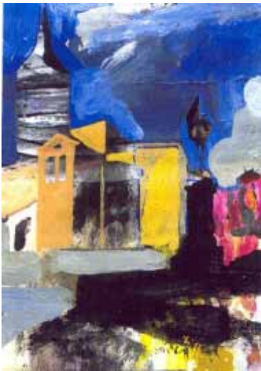
"Plaza de las sirenas"