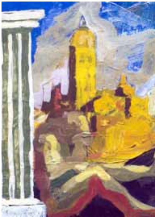
"Hércules descansa después de fundar Segovia"