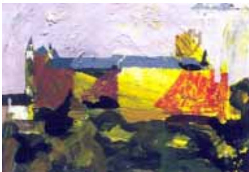
"De entre las olas"

Desandando nuestros pasos por esta misma escalera, la de la izquierda nos llevará a los altos del Pinarillo, que jamás llegó a perder su diminutivo porque el estéril suelo que lo acoge no da más que para el crecimiento de unos árboles raquíuticos, de tronco torturado y enclenque ramaje.