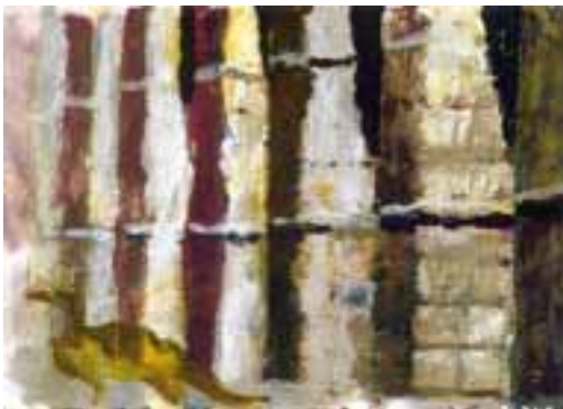
"Acueducto: la luz de Luzbel"

Esto dice la leyenda, cuyas aguas siempre ha rellenado las lagunas de la Historia. Arqueólogos e historiadores invierten luego este proceso, y con los escombros de la Historia desecan los humedales de la leyenda. Según éstos, tales marcas son los orificios donde se anclaban las grandes pinzas de hierro que se emplearon para mover los bloques de granito, izados en el vacío mediante ingeniosos mecanismos de cuerdas y poleas propulsados por el más antiguo de los combustibles: el sudor de los esclavos.