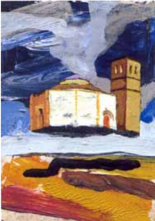
"Veracruz, ovni de piedra"