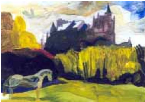
Pradera de San Marcos

verse en un lateral de la capilla. Pero durante los años veinte del siglo de igual número se levantó un pomposo mausoleo donde, estoy seguro, no acaban de acomodarse los huesos del pobre Juan de Yepes, heridos en su humildad por los mármoles y oropeles que pretendieron honrar su memoria y sólo consiguieron desvelar su eterno sueño.