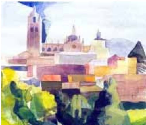
"Segovia se recuesta en la solana"